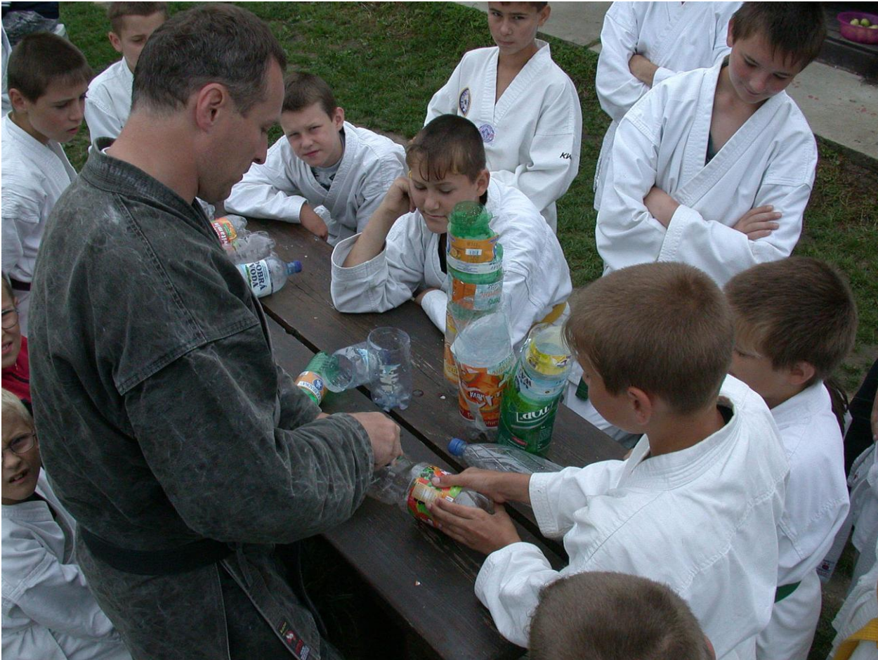
Příloha 6. – ekologická likvidace plastových lahví na táboře v Jinolicích r. 2002